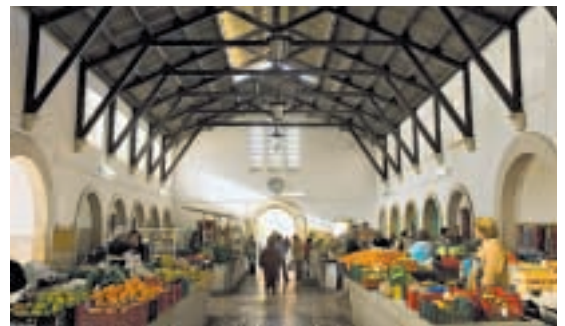
SILVES. En el mercado de Silves hay varios puestos de naranjas, fruta típica en esta localidad del Algarve interior.

En Monchique es típica la cestería, aunque la actividad ha decaído en los últimos años por la invasión de productos similares llegados de Oriente y de inferior calidad. Para compras más selectas, lo mejor es dirigirse a Vilamoura, donde se agrupan las tiendas de las grandes firmas internacionales. Menos selectas son las tiendas en Albufeira, aunque abundantes.