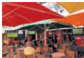
EL SETECAFE pertenece al futbolista portugués Figo, habitual en Vilamoura.

Uno de los locales más populares es Setecafé, o sea, el bar de Figo, propiedad del jugador portugués y en cuyo interior se puede ver mucha gente guapa junto a fotos de sus compañeros en los diferentes equi-