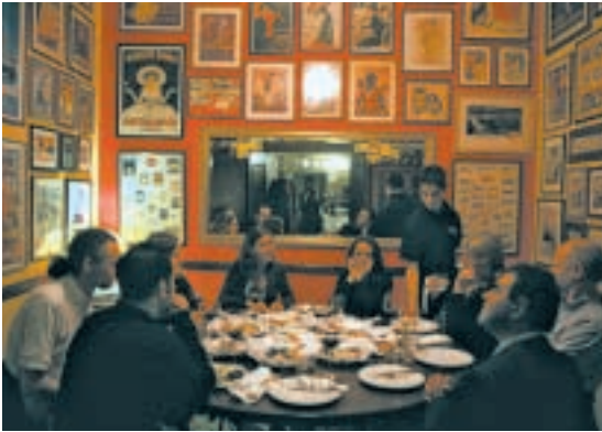
O PAIXANITO (LOULÉ). Es uno de esos restaurantes míticos por todos conocido y que merece la pena visitar al menos una vez. Es famoso por su gran menú de degustación con más de cuarenta platos (para compartir entre varios).