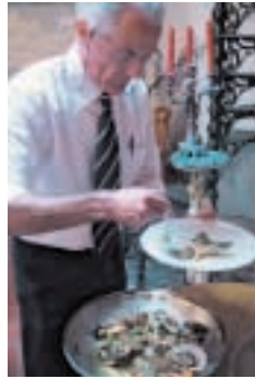
A LA CARTA EN FARO. El restaurante Vila Adentro es típico tanto por sus cataplanas de pescado como por los azulejos que decoran la paredes del local.

Quienes se acerquen al Algarve interior, concretamente a la zona de Monchique, podrán degustar un típico bollo con chorizo cocido en horno de leña, y mejor si se acompaña de aguardiente de madroño.